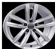
Легкосплавные диски «Dartford» 8 J x 18, серый металлик, опционально для Highline (P16)