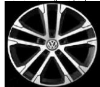
Легкосплавные диски «Salvador» Volkswagen R, 7 J x 17, опционально для Comfortline и Highline (P1D)