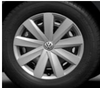
Легкосплавные диски «Moscow» 6.5 J x 16, стандартно для Trendline