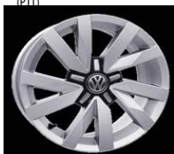
Легкосплавные диски «Serang» 6.5 J x 16, стандартно для Comfortline