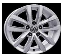
Легкосплавные диски «London» 7 J x 17, стандартно для Highline