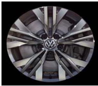
Легкосплавные диски «Nivelles» 7 J x 17, опционально для Comfortline и Highline (P14)