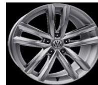
Легкосплавные диски «Singapore» Volkswagen R, 7 J x 17, опционально для Comfortline и Highline (P1C)