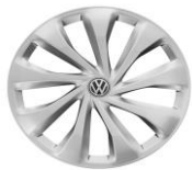
Стальные колеса 6J x 15 Стандартно для Origin и Respect